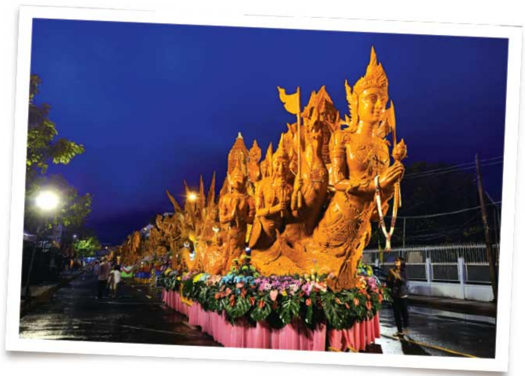
ชมการแสดงต้นเทียนในงานด่ำ

การแห่เทียนพรรษาเกิดขึ้น เนื่องจากในอดีต ชาวบ้านจะหล่อเทียนถวายแก่พระสงฆ์เพื่อใช้สำหรับการสวดมนต์ในระหว่างการจำพรรษาที่วัด โดยมีความเชื่อว่า จะทำให้ชีวิตเจริญรุ่งเรืองเหมือนความสว่างไสวของเทียนนั่นเอง